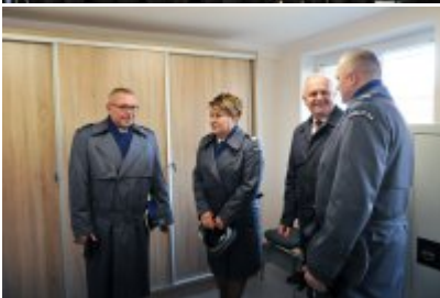
MSZA ŚWIĘTA W ROKITNIE