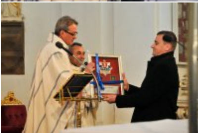
OTWARCIE POSTERUNKU POLICJI W ZBĄSZYNKU