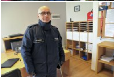
OTWARCIE POSTERUNKU POLICJI W PRZYTOCZNEJ