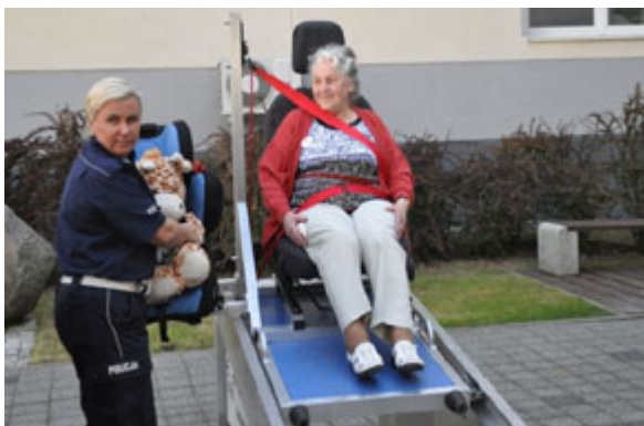
Zielona Góra - 16 maja 2016 r.