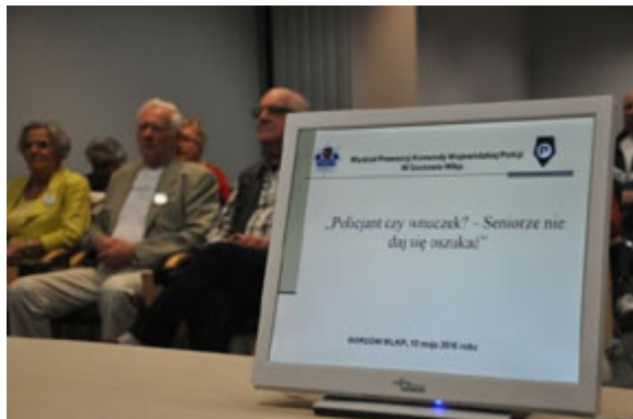
sprzętu policyjnego;Gorzów Wlkp. - 10 maja 2016 r.