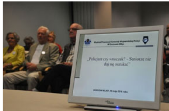
sprzętu policyjnego;Gorzów Wlkp. - 10 maja 2016 r.